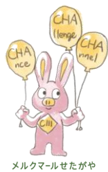
メルクマールせたがや