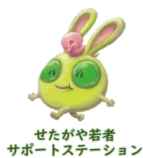
せたがや若者サポートステーション

※メルサポは世田谷若者総合支援センターのメルクマールせたがやとせたがや若者サポートステーションが共同で運営しているプログラムです。