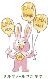
メルクマールせたがや